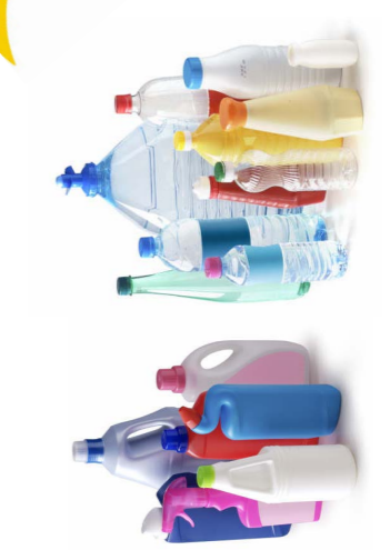
Toutes les bouteilles et tous les flaconnages en plastique