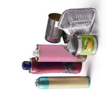
Tous les emballages en métal