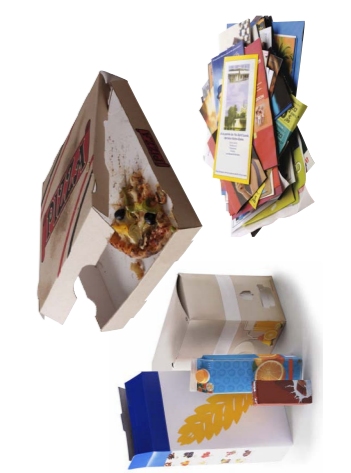
Tous les cartons et papiers (y compris les cartons souillés)