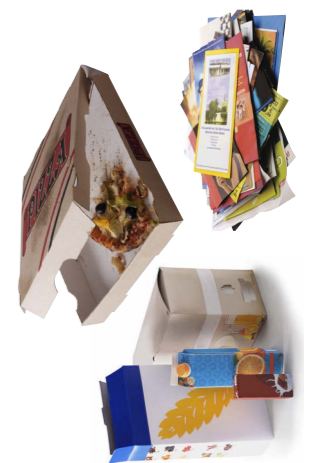
Tous les cartons et papiers (y compris les cartons souillés)