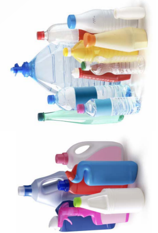
Toutes les bouteilles et tous les flacons en plastique