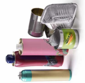
Tous les emballages en métal