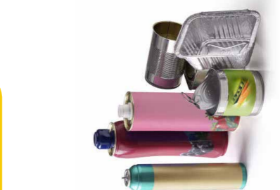
Tous les emballages en métal