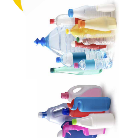
Toutes les bouteilles et tous les flaconnages en plastique