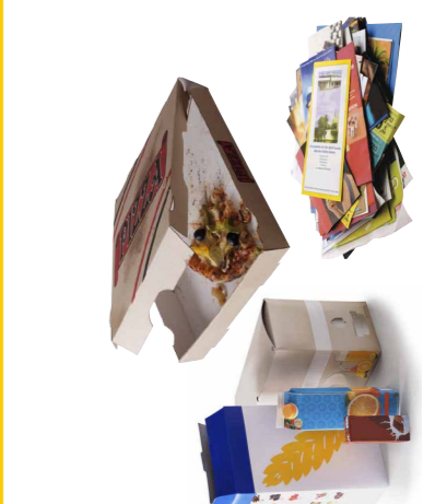
Tous les cartons et papiers (y compris les cartons souillés)