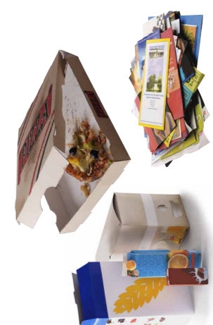
Tous les cartons et papiers (y compris les cartons souillés)