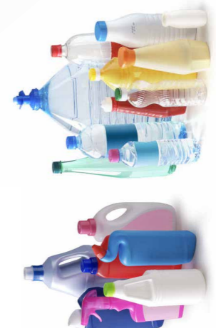
Toutes les bouteilles et tous les flacons en plastique