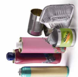
Tous les emballages en métal