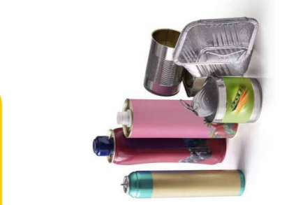
Tous les emballages en métal