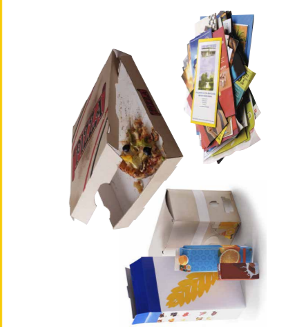
Tous les cartons et papiers (y compris les cartons souillés)