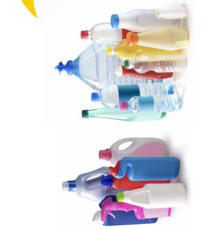
Toutes les bouteilles et tous les flacons en plastique