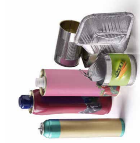
Tous les emballages en métal