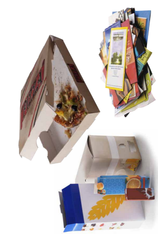
Tous les cartons et papiers (y compris les cartons souillés)