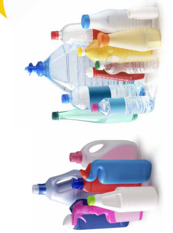
Toutes les bouteilles et tous les flaconnages en plastique