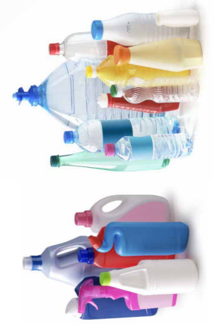
Toutes les bouteilles et tous les flaconnages en plastique