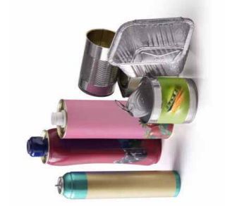
Tous les emballages en métal